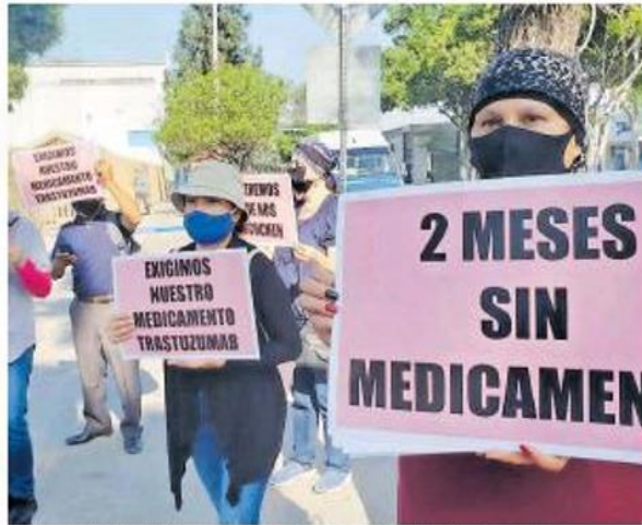
La Secretaría de Salud asegura que la escasez es a nivel nacional